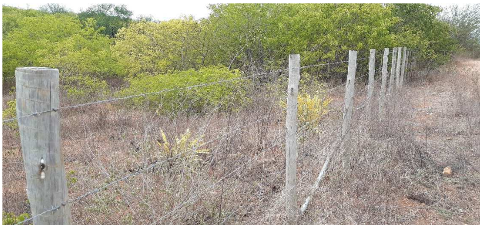
Figura 01. Exemplo de cercamento utilizando estacas de eucalipto e fios de arame farpado.